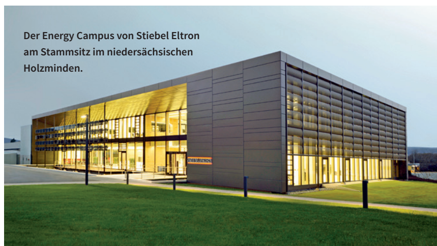
Der Energy Campus von Stiebel Eltron am Stammsitz im niedersächsischen Holzminden.

+ Stiebel Eltron Vertriebszentrum Ost Magdeborner Straße 3 04416 Markkleeberg leipzig@stiebel-eltron.de